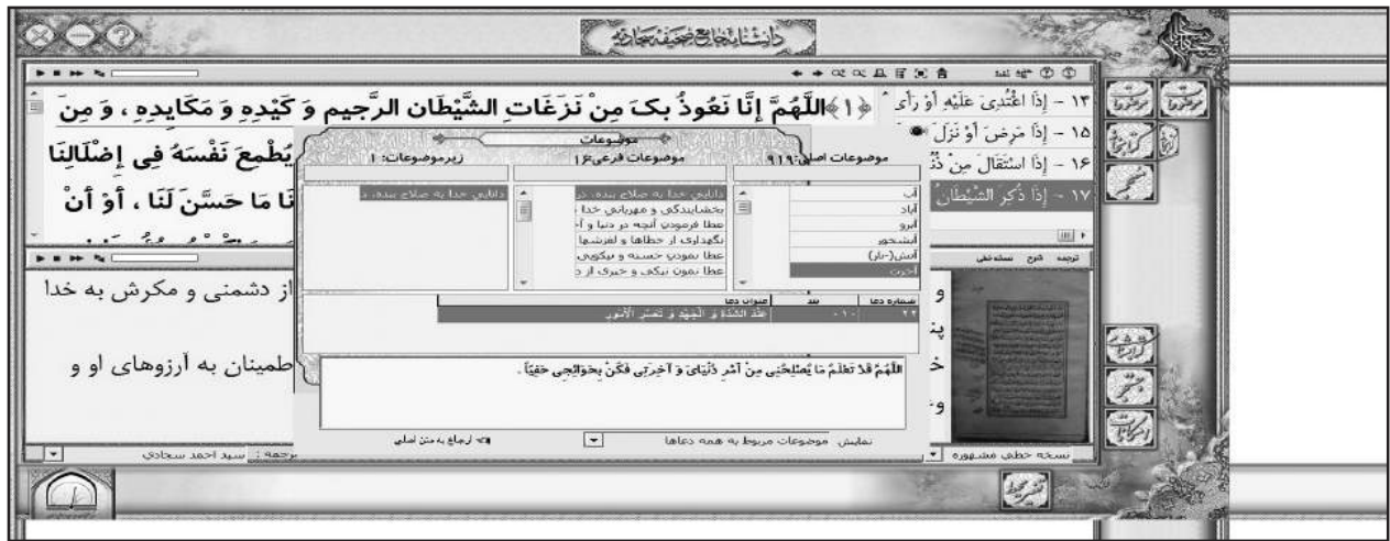
تصویر شماره ۱: نمایی از نرم افزار «دانشنامه جامع صحیفه سجاده»