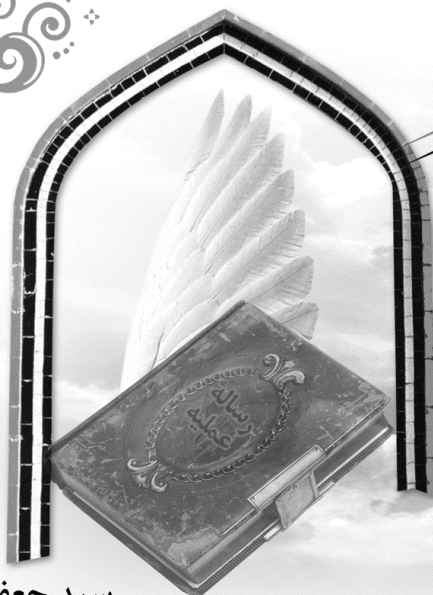
سید جعفر ربّانی