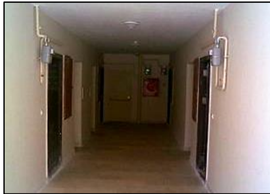
تصویر ۲- درهای ورودی واحد ها روبروی هم

این عوامل از مجموعه ای از کارهای فرهنگی و حتی قانونی تشکیل شده که به ذکر آن می پردازیم. شاید بهترین اقدام در این زمینه آگاه کردن افراد به حقوقی باشد که در شرع و قانون ذکر و با اجرای آن حقوق همسایگان از آزار یکدیگر در امان خواهد بود. شیوه خاص ساختمان سازی ها گاهی کاملاً اشتباه می باشد و به جای اینکه به آسایش افراد توجه شود به زیبایی آن پرداخته شده است. از جمله: قراردادن در های رفت و آمد ۲ خانواده رو به روی هم به طوری که اگر هر دو همزمان از خانه خارج شوند به یکدیگر برخورد خواهند کرد (تصویر ۲).