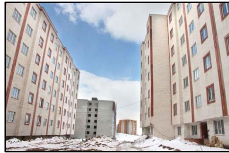
تصویر ۳- وجود اشراف بصری به واسطه پنجره ها

۸- عدم وجود مکان های فرهنگی مذهبی نظیر مساجد، حسینیه ها برای انجام فرایض دینی و مذهبی ۹- فاصله دور از مرکز شهر، مراکز درمانی و بیمارستان ها ۱۰- وجود عوامل اجتماعی که خانوارها را در این آپارتمانها را تحت تأثیر قرار میدهد، مانند بعد خانوار، تراکم خانوار در واحد مسکونی، میانگین سنی، میزان تحصیلات، مالکیت واحد مسکونی، که در ذیل به برخی از آنها اشاره می شود: