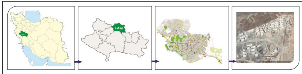
شکل ۱ - موقعیت مکانی بروجرد و مسکن مهر آن

شهر بروجرد از نظر تقسیمات سیاسی متعلق به استان لرستان در غرب کشور است. این شهرستان در شمال استان واقع شده است و در ارتفاعات بیش از ۱۵۰۰ متر قرار دارد. وسعت این شهرستان ۱۶۰۶ کیلومتر مربع است که ۵/۷۲ درصد از مساحت استان لرستان را تشکیل میدهد. این شهرستان در ارتفاع ۱۵۸۰ متری از سطح دریا و در عرض های شمالی حداقل ۳۳ درجه و ۳۶ ثانیه و حداکثر طول ۳۴ درجه و ۶ دقیقه و طول شرقی و داخل ۴۸ درجه و ۲۷ دقیقه و حداکثر ۴۹ درجه و ۲۷ دقیقه قرار دارد. (شکل ۱).