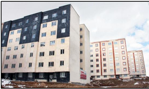
تصویر ۴- وضع نابسامان اطراف بلوک ها از نظر آسفالت و نظافت شهری

۲- عدم وجود امنیت از باب استراق سمع به واسطه عرض کم دیوارها و سقف خانه ها و همجواری درهای ورودی؛ به طوری که در مطالعات میدانی و با مصاحبه افراد، ساکنین اذعان داشتند که: حتی آرام صحبت کردن همسایه کناری نیز قابل شنیدن است. ۳- وجود آشپزخانه های اوپن و از بین رفتن حریم خصوصی زنان و افراد درجه یک خانواده ۴- استفاده ناصحیح از آسانسور ۵- عدم وجود واحد های امنیتی نظیر نیروی انتظامی در محدوده این آپارتمانها برای تأمین امنیت این آپارتمانها ۶- عدم وجود فروشگاه های مواد غذایی و سوپر مارکت ها در محدوده این آپارتمانها و به تبع آن افزایش سفرهای درون شهری و صرف هزینه و سوخت و ایجاد ترافیک جهت تأمین مواد غذایی مورد نیاز خانوارها ۷- عدم برخورداری از خدمات شهری مناسب نظیر جمع آوری زباله، نظافت معابر بین بلوک ها، آسفالت و ... (تصویر ۴).