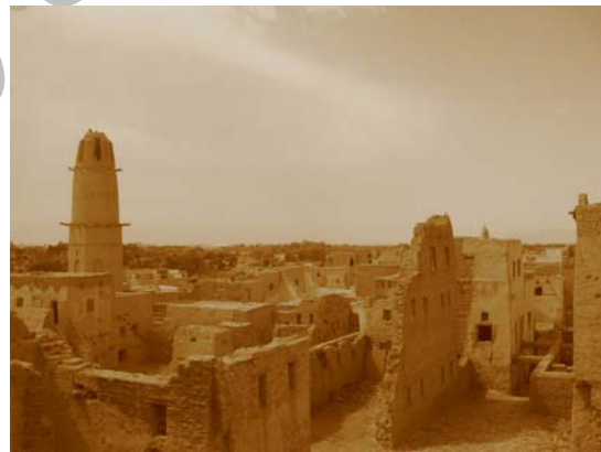
تصویر شماره ۲: روستای دخله، ماخذ: thisfabtrek.com