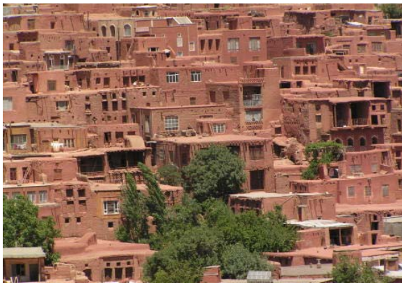
تصویر شماره ۳: روستای ایبانه

پیرامون بازیافته و به نقش مسکن در کنار انسان و موضع‌گیری مکان در روابط اجتماعی انسان تمرکز یافته است (ارجح، ۱۳۸۰، صص ۱۷-۲۵). نمونه این مطلب را می‌توان در تناسب کالبدی روستاهای ایران مشاهده نمود (تصویر شماره ۳)