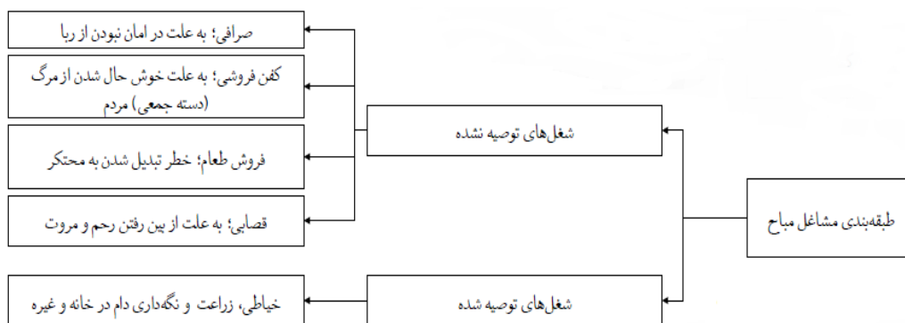
شکل ۲- طبقه بندی مشاغل مباح

بسیاری از مشاغل در اسلام مباح می باشد و بنابر اصل اباحه می توان برای کسب و درآمد زایی از ابزار آن شغل بهره مند گشت. مباح بودن یعنی عملی است که انجام و ترک آن بر مکلف مساوی است؛ نه عذابی دارد و نه پاداشی؛ مانند راه رفتن. هر آنچه در موارد چهارگانه واجب حرام مستحب مکروه نباشد در قلمرو مباحات تلقی می گردد (فلاح زاده، ۱۳۸۴: ۲۲). با تتبع در روایات در می یابیم که دو دیدگاه برای مشاغل مباح در نظر گرفته شده است و در اسلام به دو گونه فعالیت اقتصادی مباح اذعان شده است. نخستین آن در رابطه با مشاغل مباحی که بسیار توصیه گردیده و نوع دیگر آن، مشاغلی است که از آن نهی شده است.